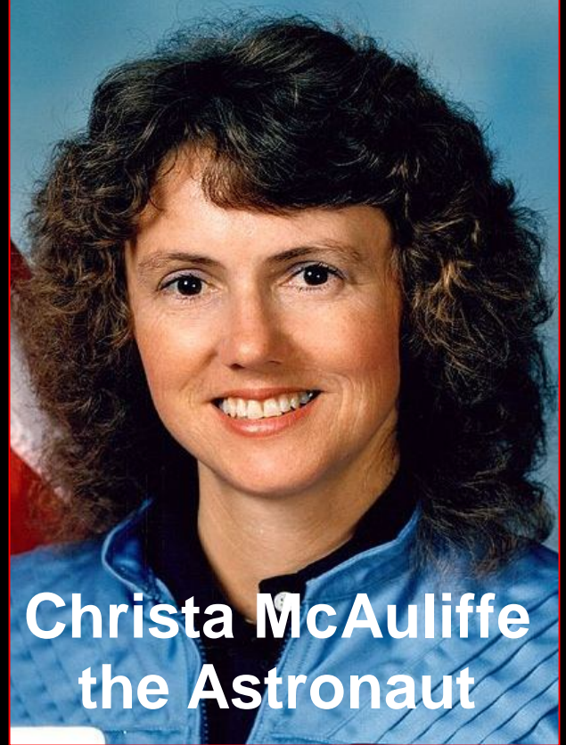
Christa McAuliffe the Astronaut

Sharon Christa Corrigan (September 2, 1948 – January 28, 1986)