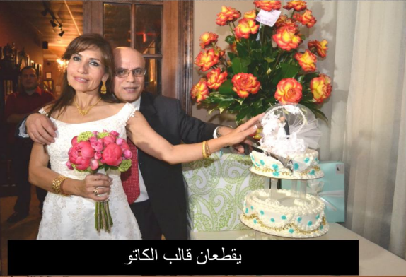
يقطعان قالب الكاتو