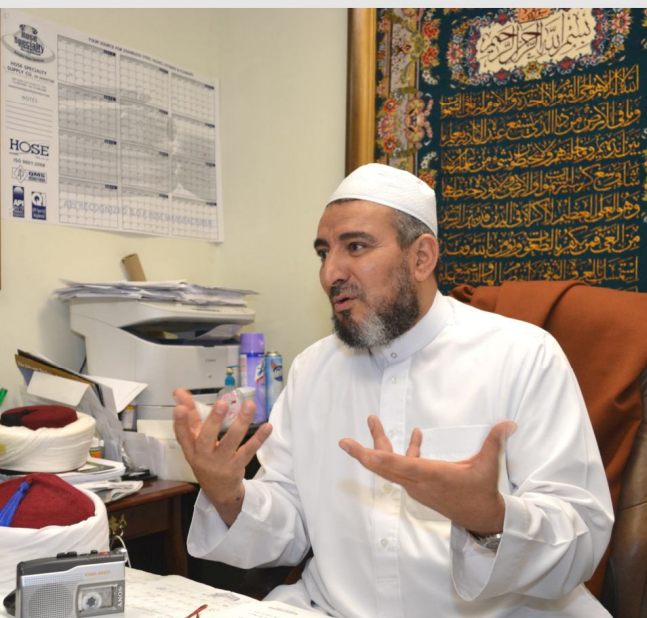
ليلة القدر خير من ألف شهر