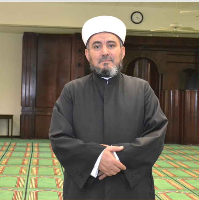
مسجد الفاروق ليلاً نهاراً ابوابه مشرعة

المتحدة الأميركية ولم أزل مستقراً فيها في خدمة مسجد الفاروق والدين الإسلامي والجالية العربية.