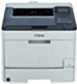
IMAGE CLASS LBP7660Cdn Color Laser Printer 5089B010AA