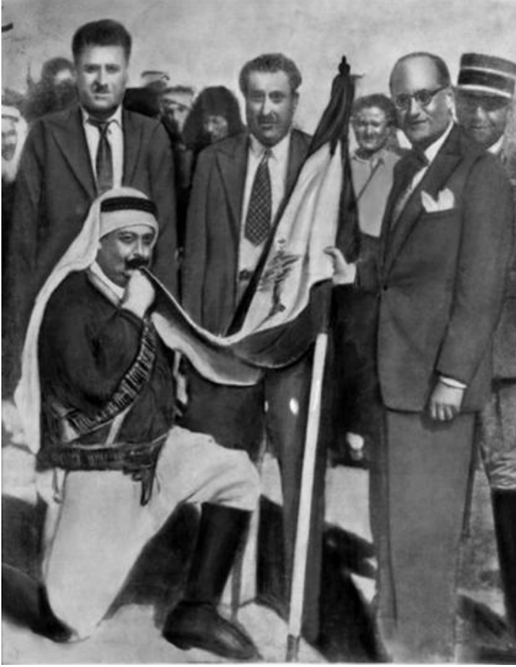
المير مجيد ارسلان يُقبل العلم اللبناني في بشامون

الصراع الفرنسي - الفرنسي من دون ان تحقق اي نجاح يذكر ،لأن هذه الوحدات تطوعت اصلاً في جيوش الحلفاء بهدف تحرير لبنان ولم تكن في وارد التخلي عن هدفها الاصيل. وهكذا اجتمع في 26 تموز 1941 اربعون ضابطاً لبنانياً في زوق مكاييل ووقعوا وثيقة شرف تعهدوا فيها بعدم الخدمة الا في سبيل لبنان، كما تعهدوا بأن تختصر علاقتهم بالحكومة الوطنية ومنها يتلقون الاوامر فقط ،وفي ختام الوثيقة ربط الضباط استئناف مهامهم العسكرية بالحصول على وعد قاطع من السلطات الرسمية الفرنسية باستقلال وطنهم وهذا ما حصل ،اذ القى الجنرال ديغول الذي كان موجوداً في بيروت حينها خطاباً وعد فيه بمنح لبنان الاستقلال والسيادة في 29 آب و 5 أيلول عام 1943. جرت انتخابات نيابية في لبنان وعلى اثرها تم انتخاب الشيخ بشارة الخوري رئيساً للجمهورية الذي بدوره قام بتكليف رياض الصلح بتشكيل الحكومة . وهكذا مع الرجلين بدأت معركة الاستقلال تعيش لحظاتها الحاسمة من خلال البيان الوزاري الشهير الذي تضمن سياسة الحكومة الاستقلالية ،تلاه قيام مجلس النواب بتعديل مواد الدستور المتعلقة بالانتداب وتوقيع رئيس الجمهورية على هذا التعديل.