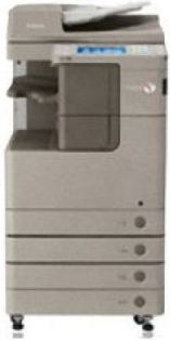
IR ADVANCE 4200 Series ( B/W Only )

Designed for busy workgroups that demand outstanding versatility in a compact space