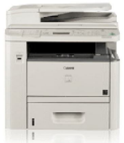
IMAGE CLASS D1350 Black & White Laser Multifunction