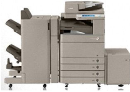
IR ADVANCE C5200 Series ( B/W, Color )

Compact yet powerful for workgroup environments