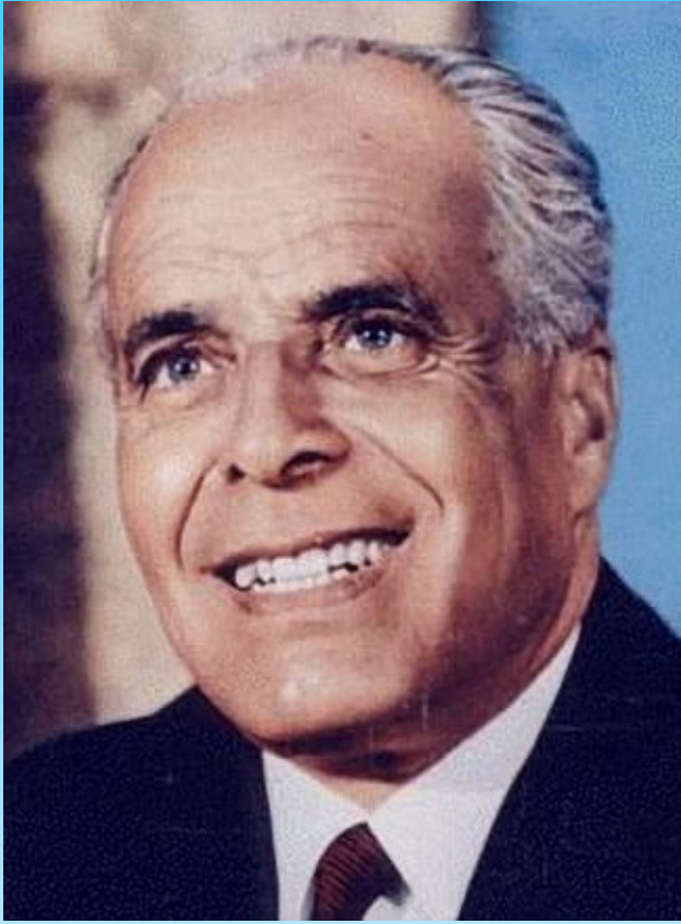
الرئيس الراحل حبيب بورقيبة