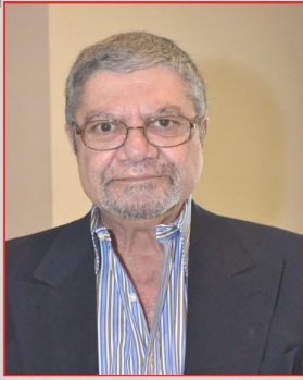
By Tony Choufati