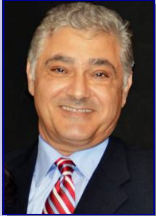
بقلم: سميح بعقلين

هل يعقل ان اختصر 365 يوماً بليلة واحدة.. وبلحظة انتقل من عالم 2014 الى عالم جديد يدعى 2015 . حقيقة الانسان طير بلا جوانح. وهل يعقل بإشارة واحدة من عقارب الساعة عندما تشير الى منتصف الليل ان اخسر سنة من عمري واقترب اكثر .. واكثر من المقلب الثاني. وهل بزمور في فمي وقناع على وجهي وكأس بيدي ان اقايضهم جميعاً بسنة من عمري. حقيقة العمر لحظة.. منذ لحظة كنت اصغر سنة .. وبلحظة واحدة اصبحت اكبر سنة .. ما اقواك يا لحظة فأنت تغيرين من حال الى حال بلحظة. ما اقواك يا رزنامة السنة المعلقة على الحائط وأعمارنا معلقة على اوراقك ومن يوم ليوم تسقط ورقة وتسقط معها ايامنا بلحظة. ما اقصرك يا ابتسامه وما اطول ايامك يا حزن.. الفرحة تمر بلحظة.. اما الحزن فيطول.. ويطول ويحفر بالعظم ولا يفارقك بلحظة. وقبل ان تداهمني اللحظة لتحملني الى عام 2015 طلبت منها لحظة لاضم اسرتي الى صدري ونستقبل سوياً عاماً جديداً لأنها اجمل لحظة. وأخيراً يا صديقي القارئ تمتع بحياتك، بأيامك بسنوات حياتك .. لأن العمر لحظة.