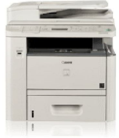
IMAGE CLASS LBP7660Cdn Color Laser Printer 5089B010AA

بيع تصليح وصيانة مع قطع الغيار وجميع انواع الحبر Cartridge