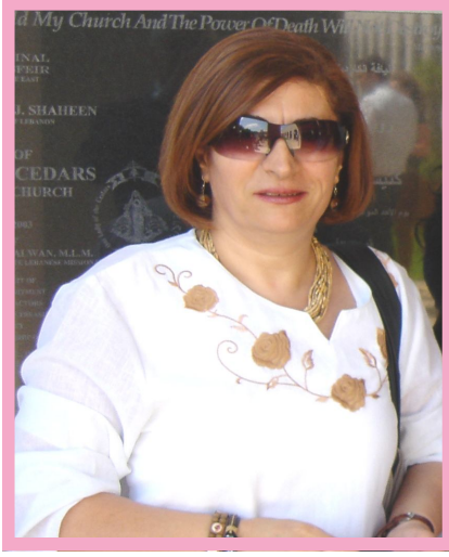
كُتبت: جوليا نادر