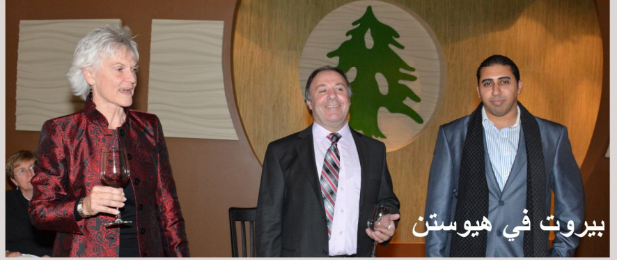
بيروت في هيوستن

تم افتتاح كافيه اماسي في هيوستن 6009 Beverly Hill St الذي يضم صالات شاسعة بل هو مدينة للمأكولات الشرقية ولعشاق الاركييلة والسهر والغناء والموسيقى . ومجلة ليبانون تايمز تتبنى له النجاح والازدهار كي تبقى اجمل الامسيات في كافيه اماسي .