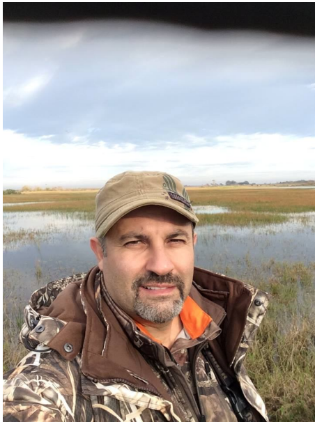
By Sam Jaoude