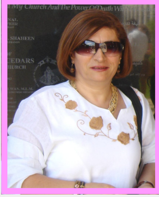
كتبت: جوليا نادر