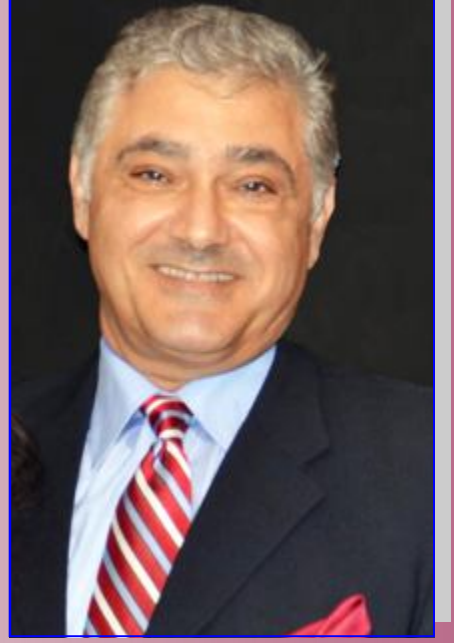
بقلم سميح بعقليني

A Lebanese flag in Houston called the Lebanese Club. They told me: The community tried hard to establish a Lebanese club in the past, but hit a dead end wall.