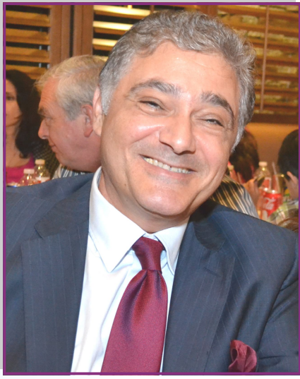
بقلم سميح بعقليني