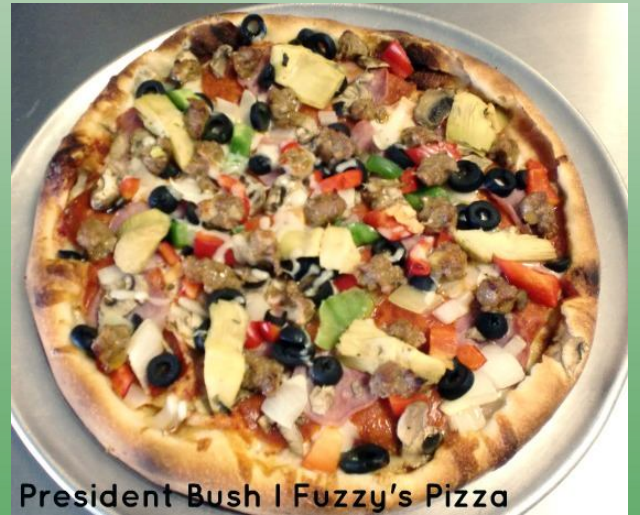
President Bush | Fuzzy's Pizza