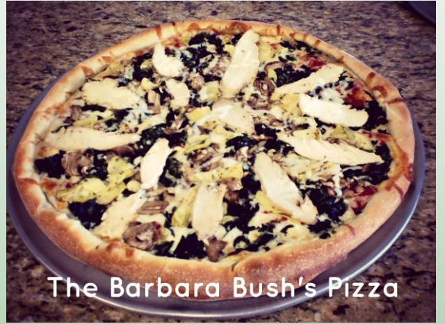
The Barbara Bush's Pizza